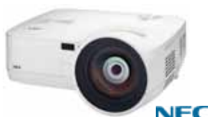
projektorem do bliskiej projekcji