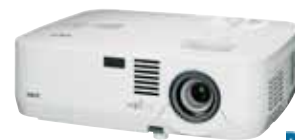
projektorem z funkcją 3D Ready